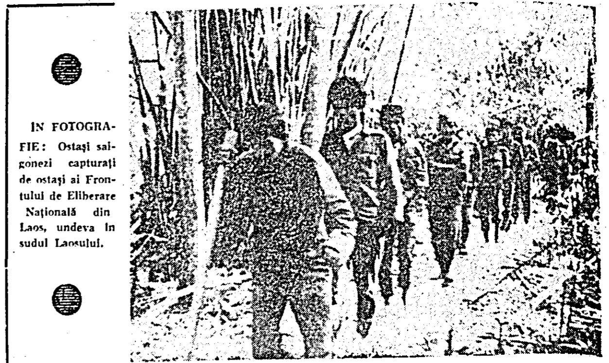
IN FOTOGRAFIE: Ostași salongezi capturați de ostași ai Frontului de Eliberare Națională din Laos, undeva în sudul Laosului.

BRUXELLES 11 (Agerpres). — O nouă rundă de negocieri dintre reprezentanții „celor șase” și cei britanici a început marți la Bruxelles, în problema aderării Marii Britanii la Piața comună. Participă miniștrii de externe și ai finanțelor din țările membre ale CEE, iar delegația britanică este condusă de Geoffrey Rippon, ministru însărcinat cu problemele europene.