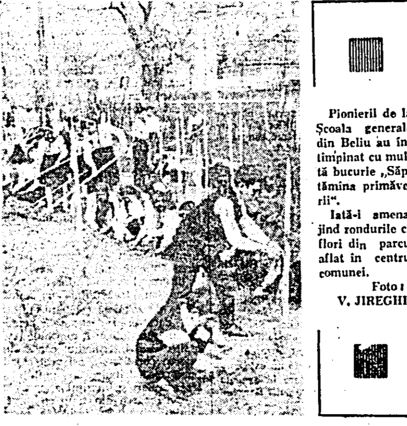
Pionierii de la Școala generală din Beliu au înfrumusețat și curățat parcul din centrul comunei.