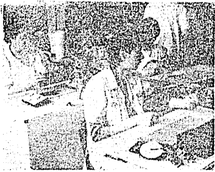
Aspect de muncă de la linia I montaj a întreprinderii de ceasuri „Victoria”, colectiv fruntaș în întrecerea socialistă.