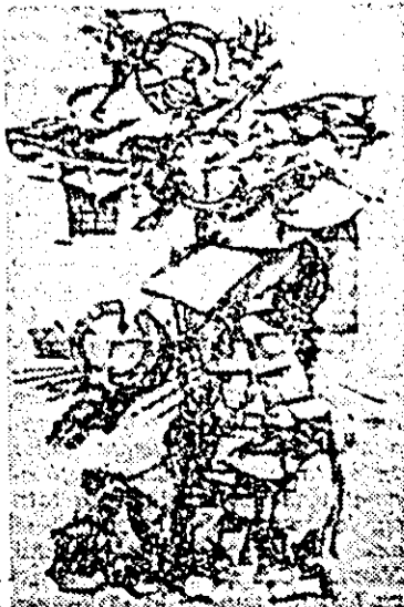
Alexandru Szabo: „Balada timpului” (grafică).