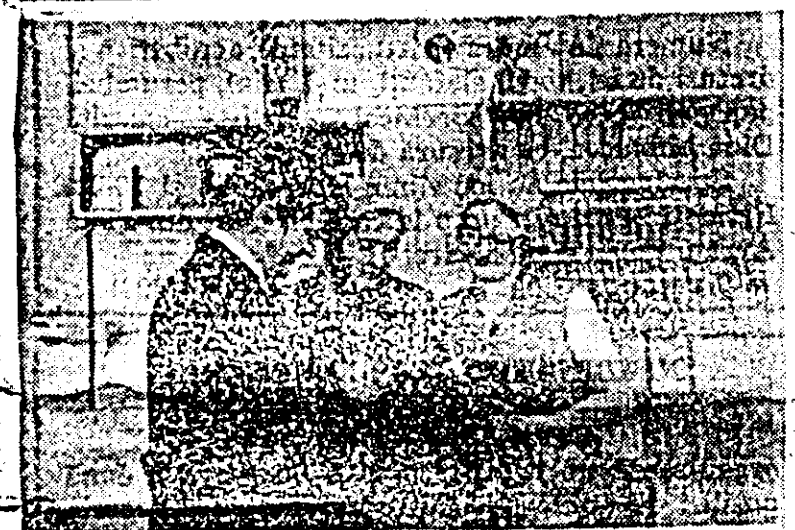
Aspect cotidian de la cabinetul de științe sociale al întreprinderii textile.

IOAN TODA, secretarul organizației de partid a școlii