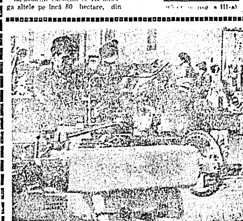
Aspect cotidian de la Uzina de strunguri.