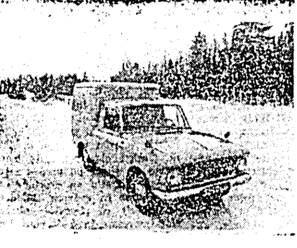
IN FOTO: Noua mașină