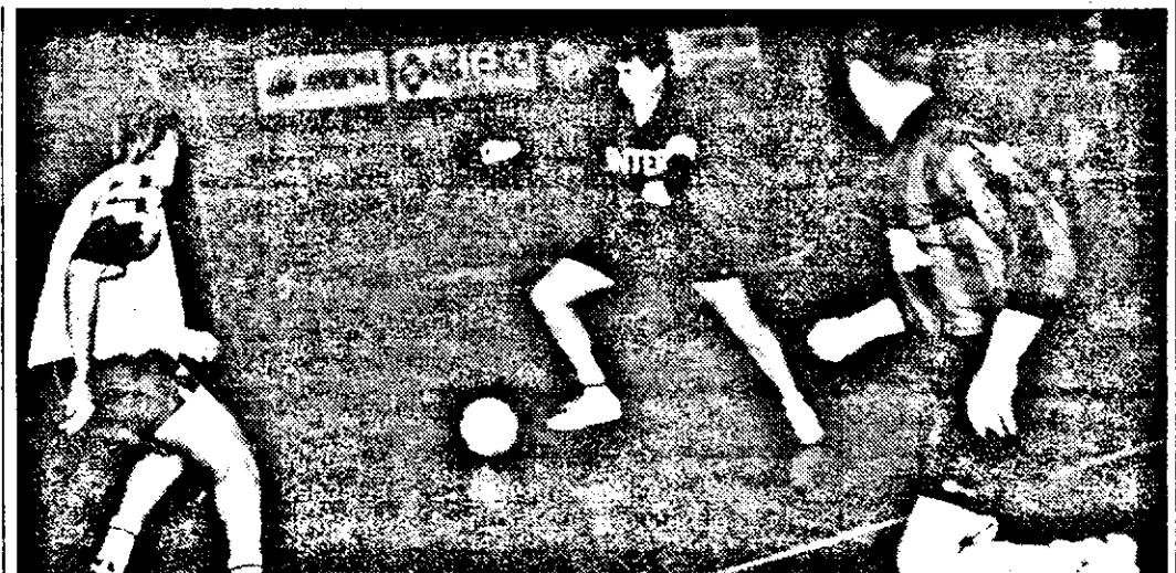
Aspecte de la finala turneului, dintre „Tano” și „Inter”