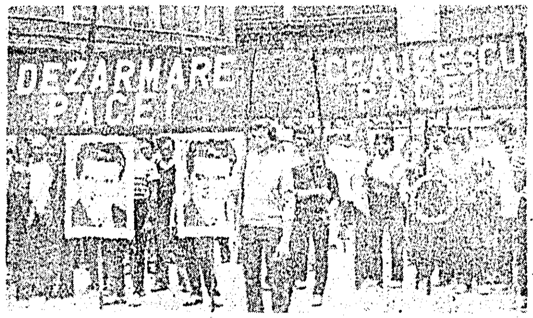
Aspect de la adunarea consacrată luptei pentru pace care a avut loc vineri, la Întreprinderea de mașini-unelte Arad.