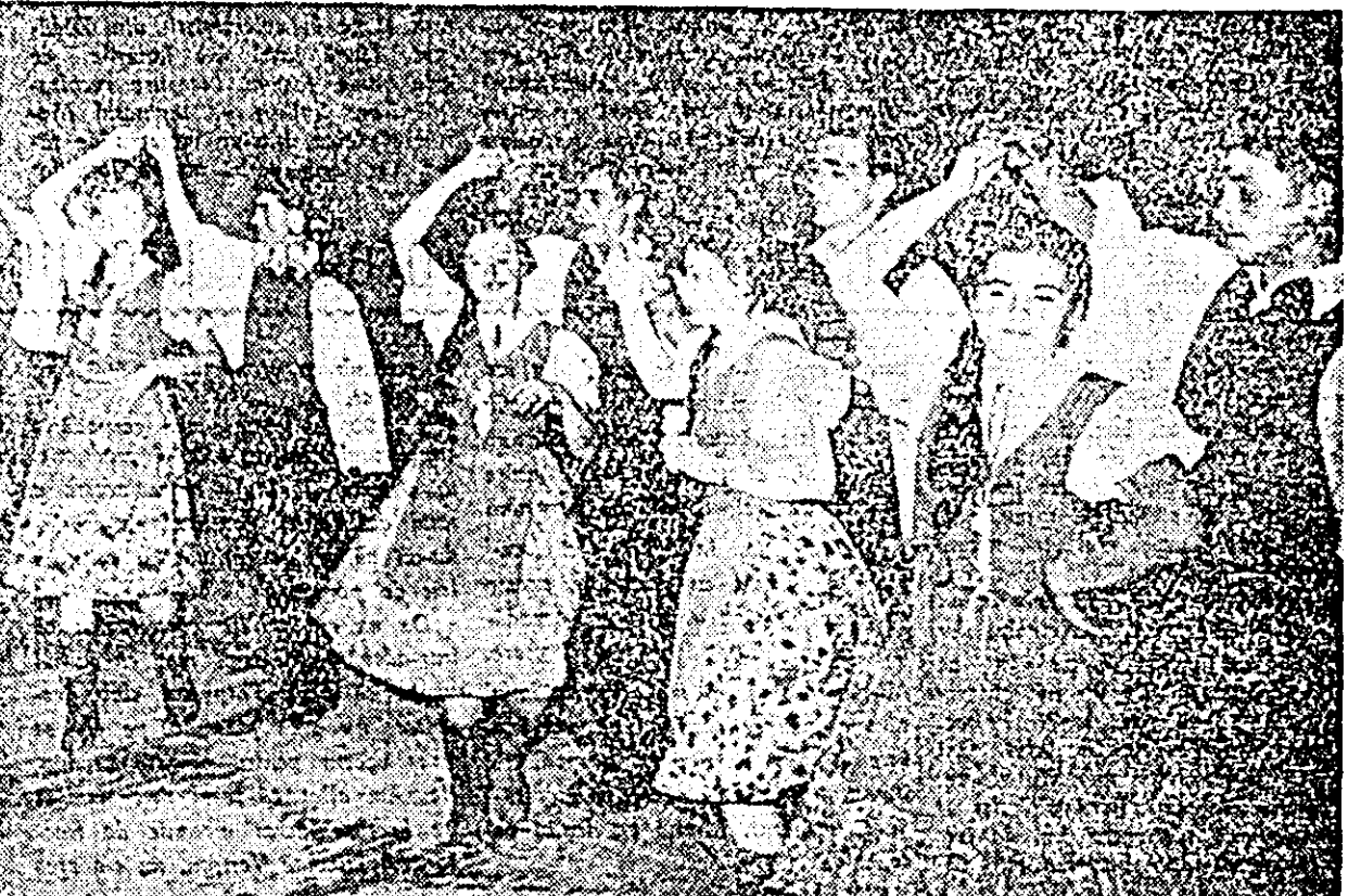
Un dans maghiar în execuția formației de dansatori din Pectea.

Acost lucru este oglîndit și de faptul că cele 250 de spectacole organizate în stagiunea 1962-1963 din care 146 la sediul, iar