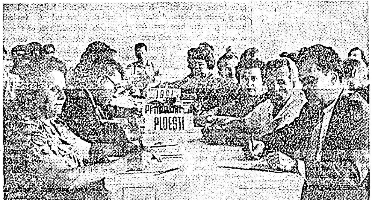
Un aspect din timpul sesiunii metodică-stiințifice a cadrelor didactice aparținând M.C.I.