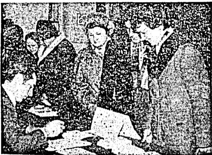
Bucurie in inimi, optimism și încredere in viitorul spre care pășim conduși de partid.