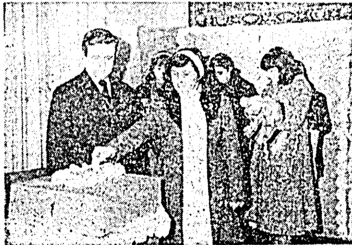
Și la Nădlac tinerii care votează pentru prima oară au știut să fie primii in fața urnelor.