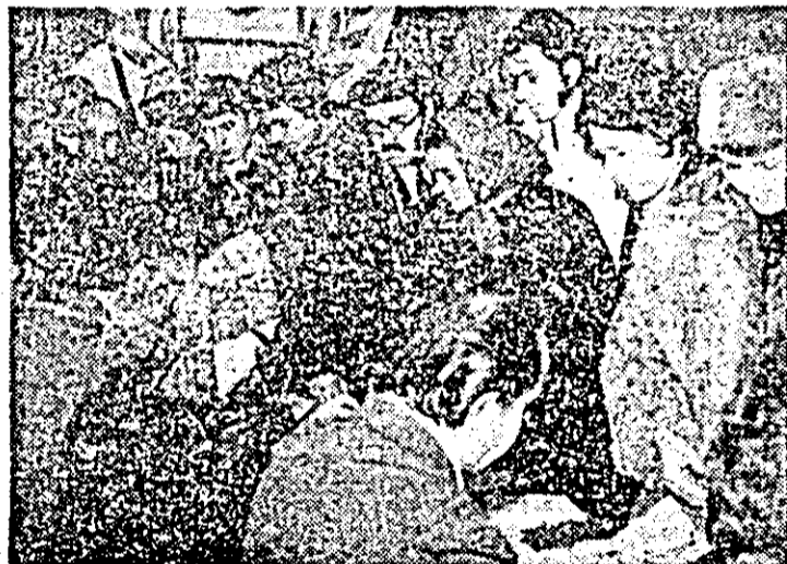
Din primele ore, aliuență de alegători și la secția de votare nr. 7, Arad.