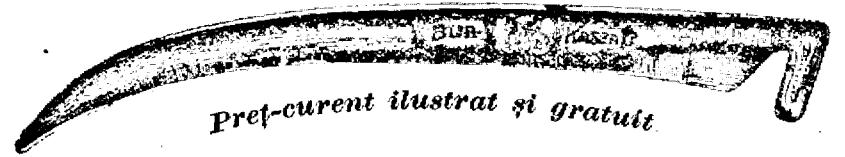
Preț-curent ilustrat și gratuit

Coasa de oțel „Bur“ numai atunci este veritabilă, da a pe- măner peartă gravată inscripția aceasta: W. G. Kőbánya , iar pe latul ei este tipăriă marca firmei cum arată figura asta: 190 2—20