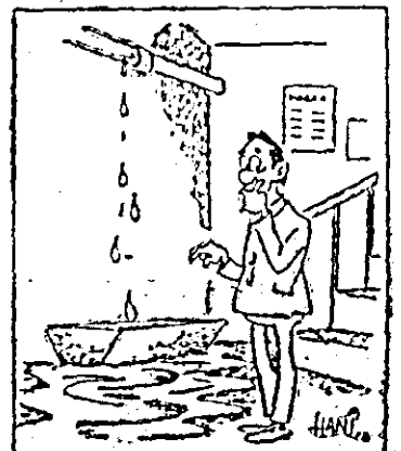
— Cite un pic, pic, pic — se face baltă!