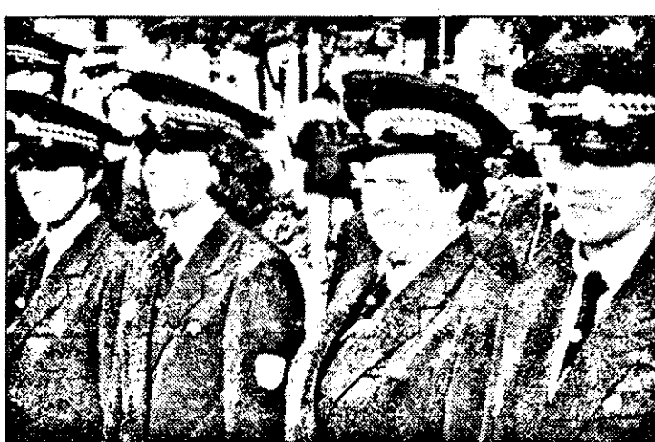
Doi momente din timpul desfășurării ceremoniei de depunere a jurământului de către gardienii publici.