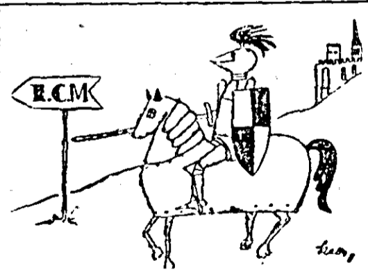
Fără comentarii. Desen de I. GROZA KETT

Întreprinderea de fabricare din fabricația de aparate de energii solare, care are capacitatea de încălzit, pe care metru pătrat, o cantitate de 50 litri de apă, folosind sursa încălzitului solar, cit și pentru alte utilități menajere.