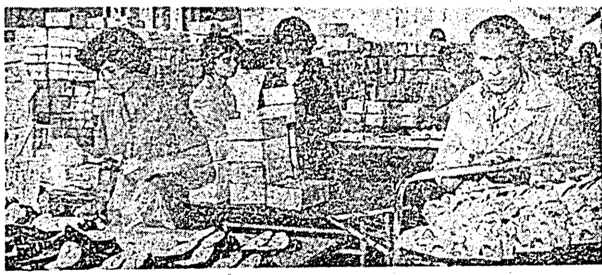
Desfășurînd cu însuflețire sporită întrecerea socialistă pentru îndeplinirea exemplară a sarcinilor de plan și a angajamentelor pe care și le-a asumat, colectivul întreprinderii „Libertatea” se preocupă stăruitor de diversificarea producției, de îmbunătățirea calității încălzimintel. Introducerea autocontrolului — expresie certă a responsabilității pentru lucrul bine făcut — controlul exigent ce se exercită pe întregul flux de fabricație asigură realizarea unor produse de calitate superioară. (ÎN FOTOGRAFIE: înainte de a fi expediată, încălzimintelii se face un ultim control.)