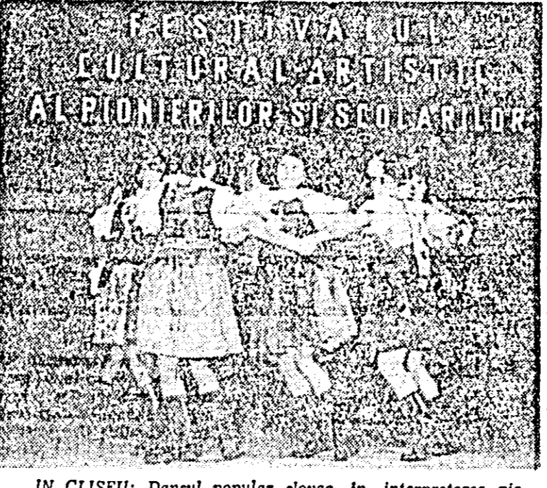
ÎN CLIȘEU: Dansul popular slovac în interpretarea pionierilor și școlarilor.