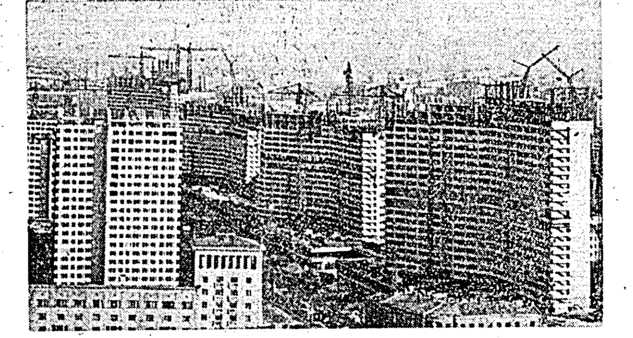
Construcții de locuințe și instituții administrative pe bulevardul Kalinin din Moscova.