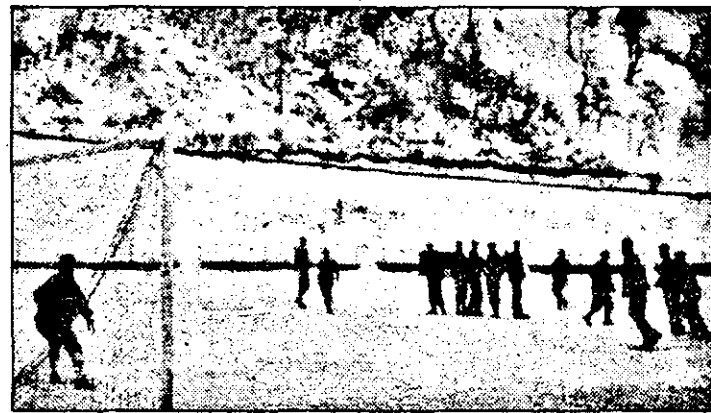
Intr-un decor hibernal, F.C. UTA își continuă pregătirea de iarnă.