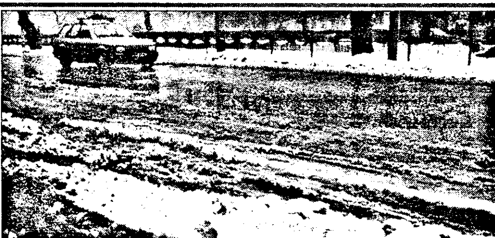
PAG. 2

Ieri, străzile municipiului nostru se umpluseră, din cauza topirii zăpezii - căzută din abundență săptămâna trecută, de băltoace. În intenția lor de a elibera carosabilele, cei de la R.A. Drumuri Municipale Arad au acoperit cu zăpadă gurile de la canalele de evacuare a apei. Apa, neavând pe unde să se scurgă, a format din loc în loc băltoace.