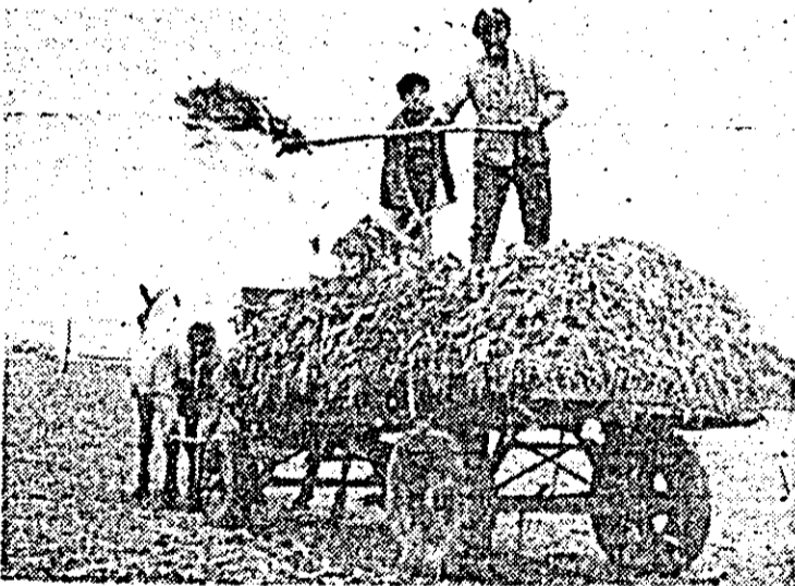
Fertilizate cu îngrășăminte naturale, pășunile vor produce furaje de bună calitate.

printre cele frumuse din județ, iar îngrășătoria de turine de la C.A.P. „Timuri noi” a predat suplimentar la fondul de stat peste 20 tone carne. Și aici, însă, în acest sector, există importante rezerve pentru ridicarea la un nivel superior a producției zootehnice. Analizînd cu toată răspunderea sarcinile care ne revin pe linia creșterii producției de lapte și lână, îmbunătățirii indicelui de natalitate al la bovine cîi și la ovine, întregul colectiv de muncă este ferm hotărît să valorifice integral rezervele de care dispunem în continuare în zootehnie pentru creșterea eficienței activității în fiecare fermă. Două sînt direcțiile principale în care ne propunem să acționăm cu prioritate: perfecționarea muncii de selecție a efectivelor în vederea obținerii unor exemplare mătci și reproducători de înaltă valoare biologică și îmbunătățirea condițiilor de furajare, prin spo-