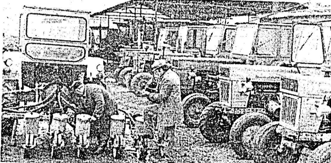
Utilajele agricole — reparate și verificate în totalitate — sînt pregătite să intre pe ogoare.

În ce privește furajarea, dorim să prezint o experiență proprie pe care o consider deosebit de avantajoasă. Avînd în vedere potențialul productiv ridicat al solului din Pecica, producțiile vegetale mari pe care le dă, datorita noastră, a specialiștilor, a tuturor lucrătorilor ogoarelor, este să valorificăm superior acest bun natural fundamental al țării — pământul. Din acest motiv noi nu ne putem permite să extindem suprafața culturilor furajere și a pășunilor în concordanță cu sporirea efectivelor de animale. În același timp, însă, în zona montană, unde solurile sînt mai slab productive pășunile sînt insuficient încărcate cu animale. Luînd legătura, încă de acum trei ani, cu organele locale din Sîstarovăț — comună care dispune de finete și pășuni întinse, peste necesarul gospodării animalelor din gospodăriile populației — am reușit să închiriem o suprafață de 400 hectare pe care pășunăm anual între 4 și 5 miei de oi, astfel gînd pe aceeași cale exact aceeași suprafață pentru producția vegetală pe mânoasele pămînturi din Pecica.