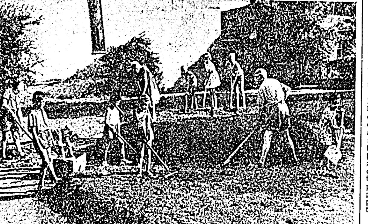
A umblat deputatul din casă în casă să amintească oamenilor despre parculeț pe care s-au angajat să-l facă.

Conștiința nu lăsa să gîndească altfel, așa că în zorii unei dimineți a pornit hotărît mai dinții să scoată pomii uscați de pe locul cu pricina.