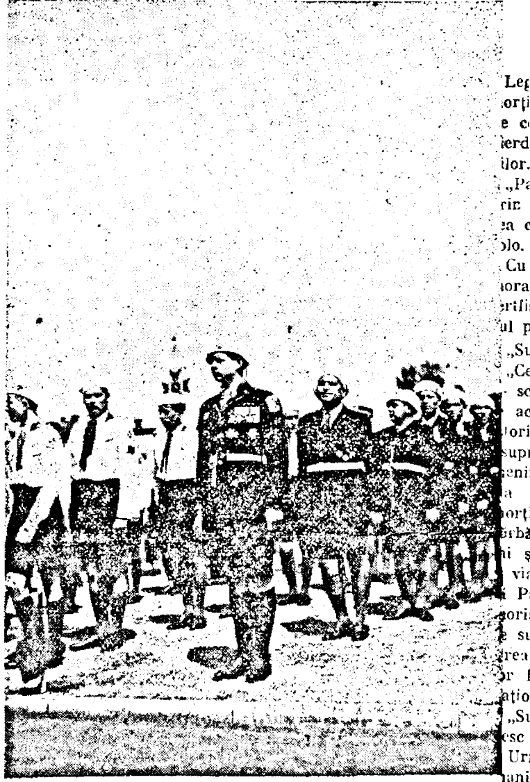
Marele Voevod de Alba Iulia, stă drept ca falnic stejar în rând cu comandanții străjerei

Regele Carol a preluat m consolidării Statului, slăbit honii, asigurându-i continuitate fortificarea.