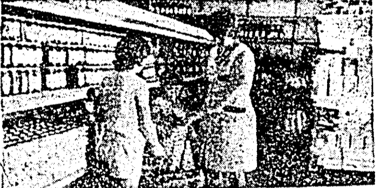
În magazinul cu autoservire din orașul Pincota.

(Poveștea slavă a vieții lui Tepeș, despre politica sa internă).