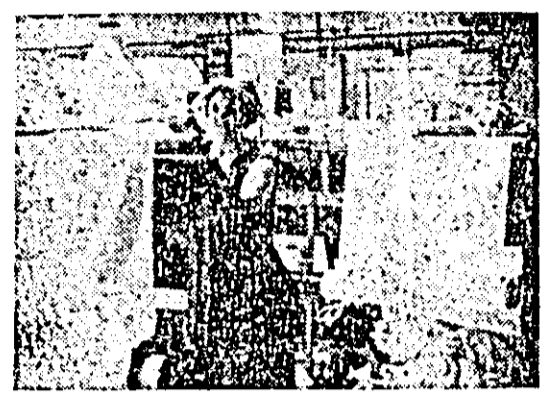
Harnicul colectiv de muncă de la întreprinderea textilă arădeană se ocupă cu mult simț de răspundere de îmbunătățirea calității produselor și diversificarea sortimentului de țesături. În CIȘEII: aspect din secția repansaj.

Încărcat cu grâu în stația CFR Sînicolaul Mare, vagonul de marfă nr. 1904-180-9 a luat drumul spre stația de destinație. Cum vagonul nu fusese pregătit corespunzător pentru transportul cerealelor, pe parcurs s-au ivit semnele neglijenței. În stația Săvișin, în dreptul ușii vagonului s-au scurs mari cantități de grâu. O grupă de muncitori au intervenit operativ, stăvindu-l scurgerea boabelor și recuperând o bună parte din grul imprăștiat pe jos. Cărb este însă că s-a produs o pagubă de câteva sute de kilograme grâu, care va trebui suportată de cineva, adică de cel care au dat cale liberă unui asemenea vagon.