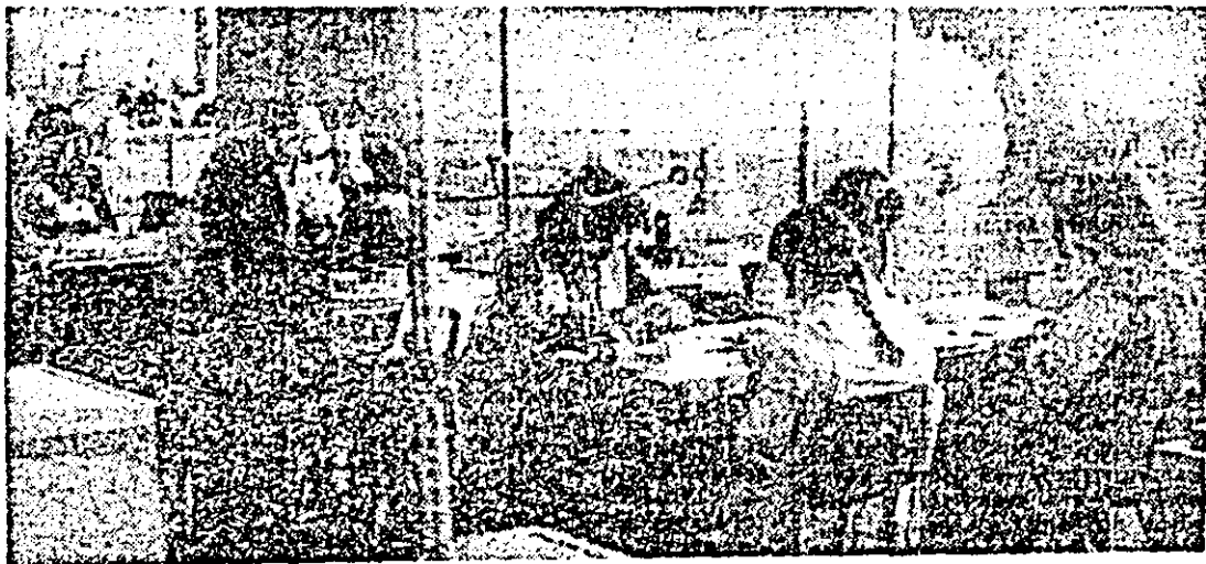
Aspect de muncă în atelierul montaj al întreprinderii de orologerie industrială.