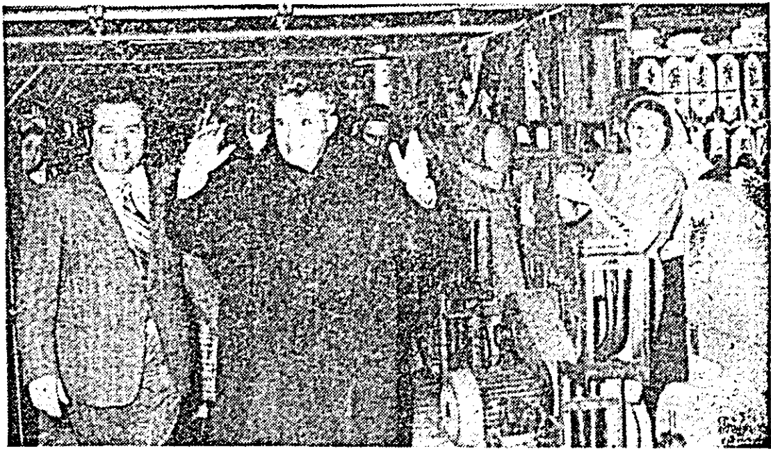
Momente de neuitat. Tovarăşul Nicolae Ceauşescu primit cu cele mai alese sentimente de simță și respect de oamenii muncii de la Întreprinderea textilă.