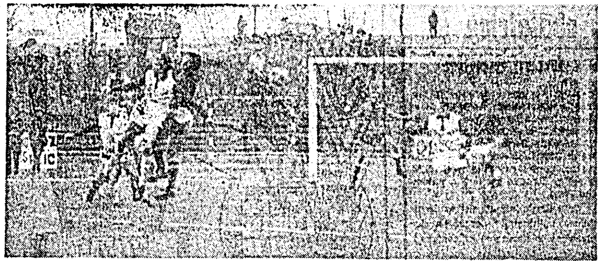
Fază din meciul UTA — Zagłębie Wałbrzych.

FRANTZ WOHRER, conducătorul jocului: „Partida a fost foarte disputată, de mare luptă. Am fost surprins de jocul viguros al polonezilor. U.T.A. este, fără îndoială, o echipă mai tehnică, dar astăzi a evoluat fără voință și putere de luptă. În repriza a II-a Zagłębie putea câștiga jocul dacă ar fi profitat mai mult de căderea localnicilor. În prelungiri U.T.A. a condus ostilitățile și a reușit pe merit calificarea. N-am avut probleme în conducerea jocului“.