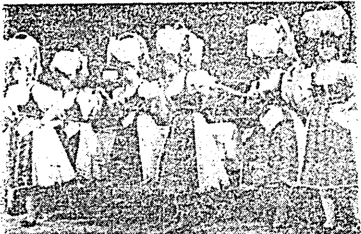
Moment din spectacolul folcloric „Pe cîmpul cu florile”.

Tot în planul unor aprecieri generale, globale, am reținut din cuvîntul de încheiere a manifestărilor culturale-