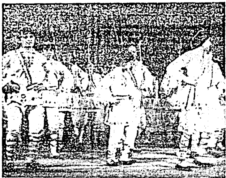
Moment din spectacolul folcloric „Pe cîmpul cu florile“.

Așadar, ultima zi a celei de-a XIV-a ediții a manifestării cultural-artistice „Primăvara arădeană“ ne-a oferit bucuria unui spectacol folcloric sărbătoresc.