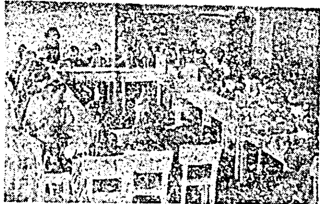
Copiii se joacă sub îngrijirea atentă a educatoarelor

Intr-o clădire frumoasă și spațioasă din apropierea fabricii „Tricolour” din Arad, se află grădinița de copii a întreprinderii. Zilnic, înainte de a intra pe poarta fabricii, vin aici numeroase mame spre a-și lăsa copiii în grija educatoarelor, pe timpul când ele lucrează în producție.