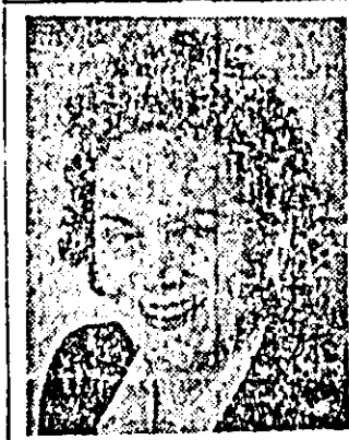
T.B.C. și în parcul spitalului vom planta peste 200 puieți de brazi, ca astfel să oferim bolnavilor aer curat.

De trei ani sînt directoarea spitalului orașenesc de pediatrie din orașul Arad. În acest timp, cu ajutorul celorlalți medici și surorii medicale, am muncit cu dragoste pentru însănătoșirea grăbnică a copiilor bolnavi care s-au perindat prin spitalul nostru.