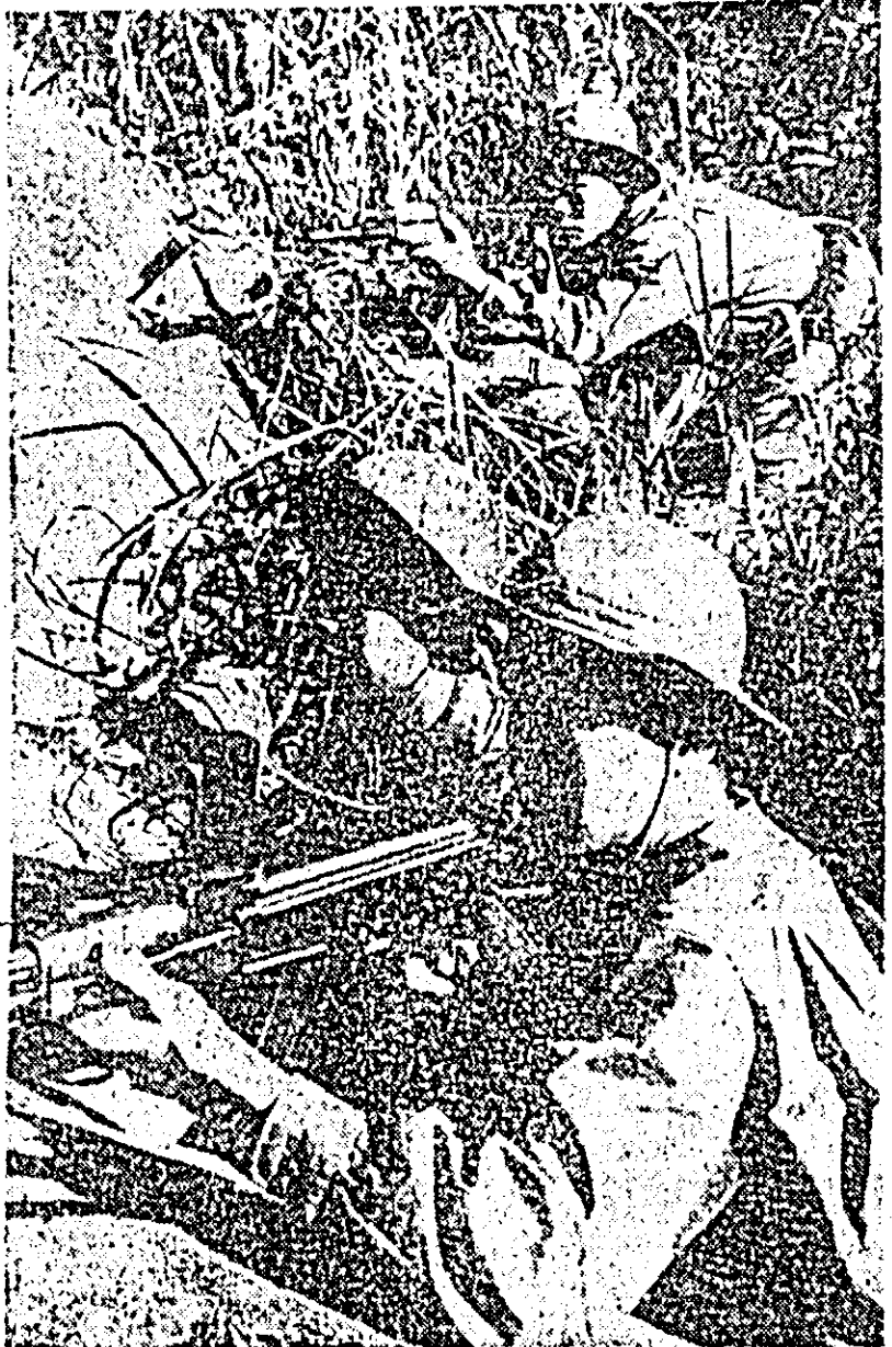
In fotografie: Ostași ai Armatei de eliberare în timpul acțiunilor de luptă în regiunea Quang Tri.

SAIGON 26 (Agerpres). — După ocuparea importantelor baze americane „Fuller”, presiunea forțelor patriotice din Vietnamul de sud continuă să se intensifice în întregul sector de vest al provinciei nordice QUANG TRI — relatează agențiile de presă. În noaptea de vineri spre sâmbătă, patrioții au bombardat cu rachete de 122 de mm bateriile americane de artilerie care mai sînt amplasate în baza asediată „Carroll”. La 9 km vest de localitatea Cam Lo, pe colinele din jurul bazei „Fuller”, au avut loc lupte violente la sol între unitățile ale forțelor patriotice și trupele saigoneze. Suferind importante pierderi în oameni, trupele saigoneze s-au retras, abandonînd pe teren material militar. Spre est, în regiunea de coastă, grupuri de patrioți au plantat mine în jurul unor poziții americane, despre care agențiile de presă informează că ar urma să fie evacuate în următoarele săptămîni. Forțele FNE au provocat trupelor americane pierderi în oameni și material de luptă. Alte angajamente au avut loc în provincia Binh Dinh, la 450 km nord-est de Saigon, unde un elicopter american a fost doborât de către patrioți, și în Delta Mekongului.