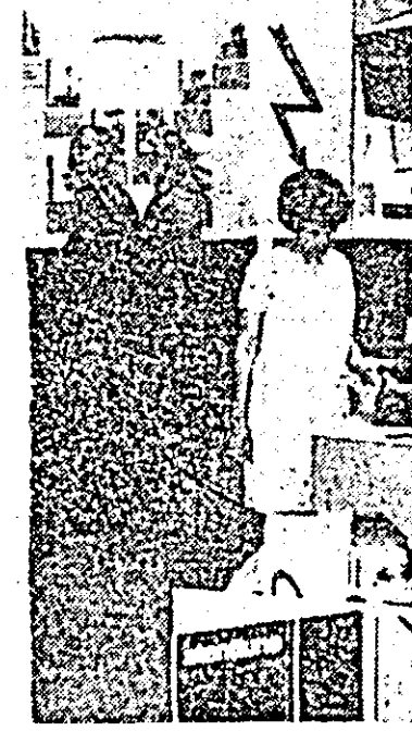
Aspect de la expoziția Protecția muncii.