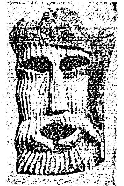
Rugăciunea unui dac