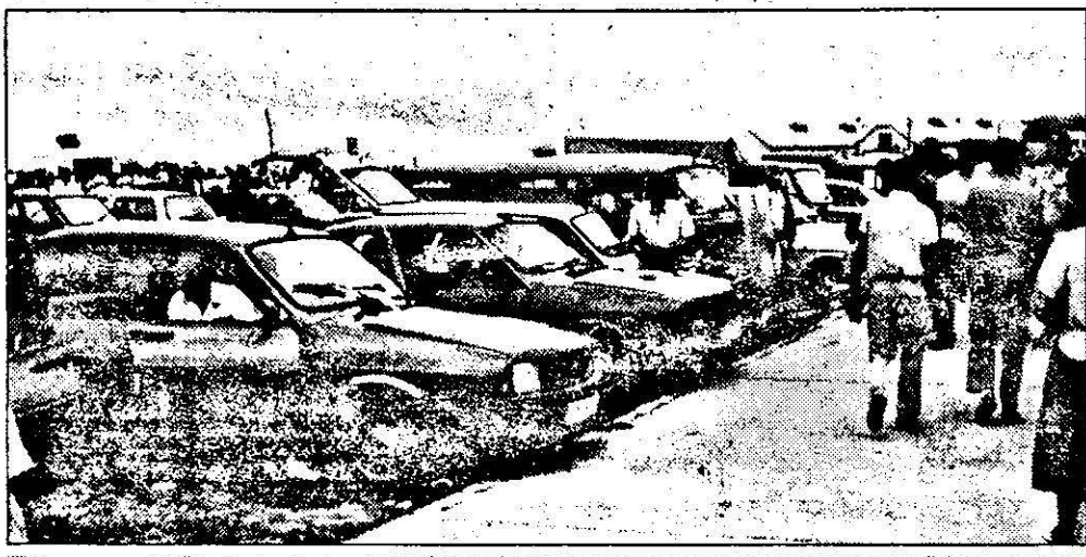
Secvență cotidiană de la Piața de mașini