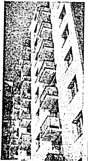
Geometria contemporană.