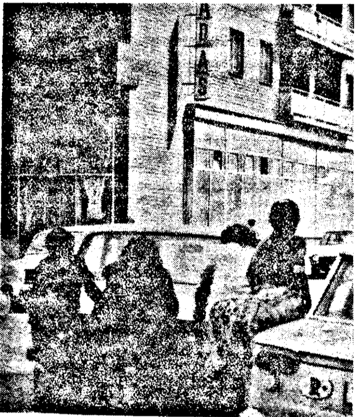
DAS — o ultimă speranță

Un grup de credincioși de la Biserica ort. rom. Arad Șega II