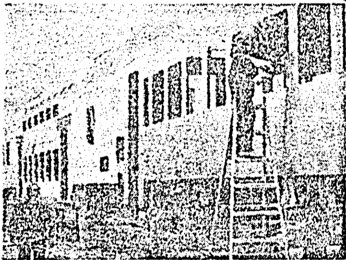
Aspect de muncă în secția montaj general-sudură a I.V.A.

Sunt fapte pentru care transmitem colectivului întreprinderii cele mai sincere și calde felicitări și urarea ca și în cincinalul următor să ne ofere posibilitatea de a scrie despre fapte asemănătoare.