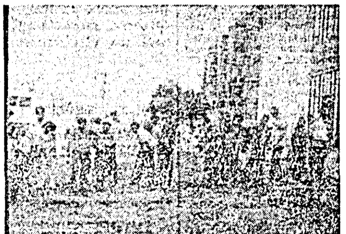
Instantaneu la una dintre recentele acțiuni cetățenești pentru buna gospodărire și înfrumusețare pe Calea Aurel Vlaicu.

pentru păstrarea în permanență a curățeniei străzilor. La blocuri, locatarii vor trebui să amenajeze și să întrețină zonele verzi și spațiile florale, să planteze pomi, arbori, arbuști ornamentali, trandafiri, gard viu, să amenajeze alei cu balast sau nisip, terenuri de joacă pentru copii, grădini de zarzavat pe terenurile nefolosite, să întrețină curățenia în jurul containerelor și alte asemenea lucrări. În cazurile în care se va constata o situație necorespunzătoare a întreținerii obiectivelor vizate, persoanele în cauză vor fi obligate la plata contravalorii zilelor neefectuate — de câte 120 lei pe zi. De asemenea, se vor aplica sancțiunile prevăzute în Legea nr. 10/1982.