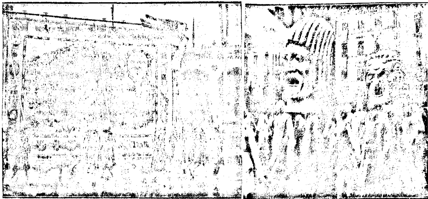
Der große Münchner Festzug — Spiegelbild von 2000 Jahren deutscher Kultur links die Skulptur des Sudentenlandes und des Reichsprotectorates Böhmen und Mähren in der Reihe der geschichtlichen Darstellungen und rechts die Gruppe „Schauspiel und Dichtkunst“ beim Wässern der Filzstrümpfe.

hat wieder Scheckfälscher verhaftet Temeschburg. Wie erinnerlich, wurden im Herbst vorigen Jahres hier mehrere Personen festgenommen, die einzu gefälschte Schecks durch Vermittler in Verkehr brachten und den Betrag von 251.000 Lei sich aneigneten. Die Täter wurden auch vor Gericht gestellt und zwei von ihnen bestraft. Die hiesige Polizei hat nun eine neue Scheckfälscherangelegenheit aufgedeckt, die aber noch im Untersuchungsstadium ist. Wegen desfalls können Namen in dieser Angelegenheit nicht veröffentlicht werden. Bisher ist so viel bekannt, daß in diese Angelegenheit einer der in obenerwähnten Angelegenheit verurteilten Täter, wie auch ein Buchdrucker und zwei andere Personen verwickelt sind.