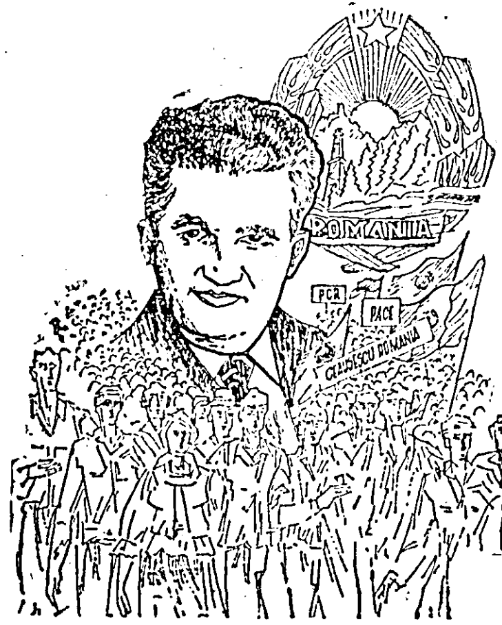
„Omagiu conducătorului” Grafică de Lucian Cocluba

• O serie de manifestări politico-educative avind ca temă aniversarea celor 15 ani de cînd în fruntea țării a fost ales ca președinte tovarășul Nicolae Ceaușescu au fost susținute și în orașul Ineu. La cooperativa „Crisul”, la secția „Tricolor roșu”, la C.L.F. au fost susținute expunerii privind „Contribuția tovarășului Nicolae Ceaușescu la îmbogățirea și dezvoltarea teoriei revoluționare a clasei muncitoare”, „Rolul hotărîrilor al tovarășului Nicolae Ceaușescu în elaborarea și înfăptuirea politicii de construire a socialismului în România”, „Tezele secretarului general al partidului — principiul de bază ale politicii de pace și colaborare a României socialiste”.