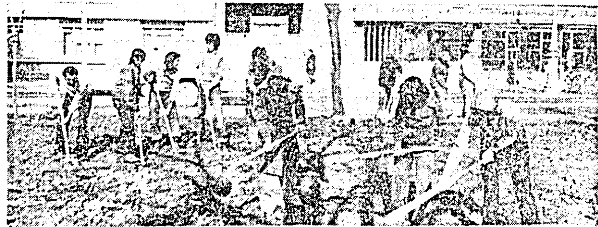
Un mare număr de elevi de la Liceul industrial nr. 8 participă zilnic la acțiunile de înfrumusețare a municipiului.

Fără îndoială că și în noul cartier Aurel Vlaicu sute de cetățeni au pornit cu hărnicie la înfrumusețarea spațiilor dintre blocuri, la amenajarea zonelor verzi, la sanzura trandafirilor. Locatarii blocurilor A 18, 19, 20, 23 au început plantatul arborilor, tufelor de lăuș și gardului viu. Pe artera principală, numeroși cetățeni participă la rașchetatul pămîntului de pe carosabil. În cartier este însă necesară o mobilizare generală a tuturor cetățenilor la lucrările de gospodărire. La grădinița de copii, cuprinsă între blocurile X 4, 5 și 6, accesul se face printr-o mare de noroi. Rău gospodărite sînt și curțile Școlii generale nr. 6, unde gardurile sînt rupte, spațiile verzi călcate în picioare, pomii tineri rupți. La Școala generală nr. 6, din cel 40 de plopi plantați ani trecuți au mai rămas doar trei.