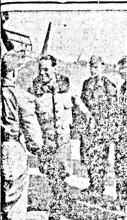
Întoarcerea dintr'un raid aviatic

Stockholm, 13. (Rador.) Havas transmite: O mare bătălie s'ar afla în curs desfășurare de astănoapte, în apropierea de Kongsviner, din direcția căruia se vede o violență canonică. O populație întreagă este rămasă în acest oraș, complet cufundat în întuneric. Hamar a fost atacată cu focuri de artilerie. Norvegienii luptă în tot acest timp. Dar până acum nu au putut să stabilească o linie continuă de apărare. Se s'au desfășurat mai ales spre nord și spre Skarneas. În orașul Elverum a rămas încă multă populație, cu toată greutatea care urmează încontinuu și cu raidurile avioanelor. Este de reținut că orașul Elverum nu este un oraș întărit. Un avion german a fost doborât aproape de lacul Glommen. La Kongsviner, germanii au minat podul care leagă orașul de interiorul țării. Un număr de 1200 germani au ocupat orașul și în port se găsesc mai multe vase.