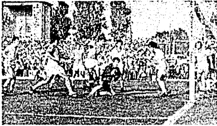
De bun augur pentru anul 1982, victoria cu 3-0 din meciul cu F.C. Constanța din agitata toamnă a începutului de campionat. Și numai jocuri aprig disputate cum sugerează imaginea de față.

Așa cum la încheierea unui an se întreprind cele mai exacte bilanșuri (și mai bogate în detalii), la începutul celui următor ne încearcă pasiunea de a pronostica. Dorința de mai bine, coroborată cu noile condiții, înțotdeauna mai fertile, mai proplice țelurilor asumate, dau o direcție mai sigură eforturilor proaspete, le fac mai eficiente. În convorbirea purtată mai zilele trecute cu antrenorul Ioan Pătrașcu, acesta, într-un exces de modestie, vorbea doar de o prămlinere a echipei sale