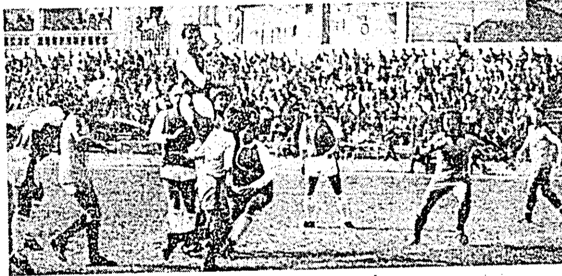
Fază din meciul de fotbal UTA - Armătura Zalău.

Selectie pentru copii şi juniori la UTA Pe toată perioada vacanţei, iar la baza Micălaça, în de primăvară (7-19 aprilie) aceeaşi perioadă, pentru ju- niorii 15-18 ani. Ce în- cează acţiuni de selecţie ast- fel: la stadionul UTA, pentru copii de la 8 la 14 ani, marţi, miercuri, joi, vineri, sîmbă- tă, iar la baza Micălaça, în aceiaşi perioadă, pentru ju- niorii 15-18 ani. Ce în- cează acţiuni de selecţie ast- fel: la stadionul UTA, pentru copii de la 8 la 14 ani, marţi, miercuri, joi, vineri, sîmbă- tă, avînd asupra lor echi- pament necesar.