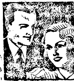
Ha egy hölgy Odol fogkrémet használ, bizonyos lehet bájja felől, ha kívülről nézi fogait.