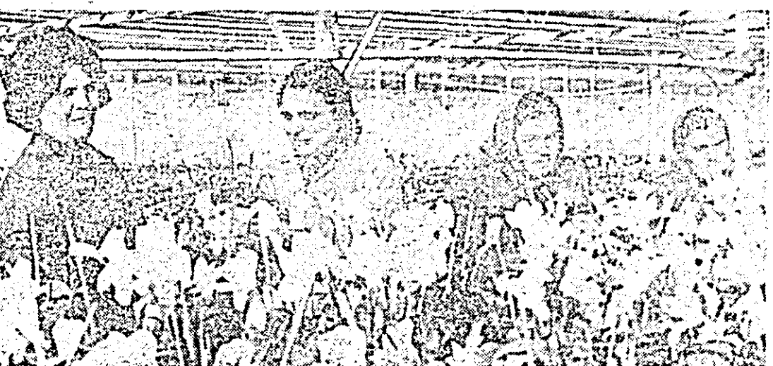
CLIȘEU: Sub cupolele de sticlă ale serelor, cresc minunatele flori care ne încântă privirea.