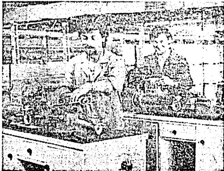
Secția Chișineu Criș a I.M.U.A. Aspect de muncă la montarea strungurii SP 80.

Cu acest prilej, tovarășul Nicolae Ceaușescu a acordat un interviu pentru ziarul „Al Qabas”.