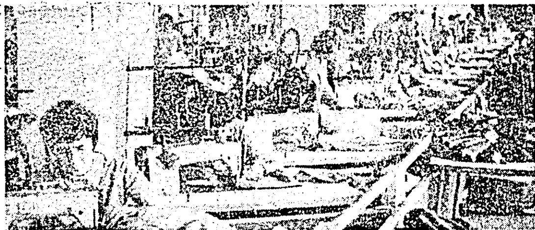
Instantaneu de muncă din secția a III-a a întreprinderii de confecții.