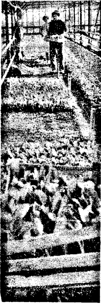
Pregătirea răsadurilor, o lucrare de actualitate pentru toți cultivatorii de legume.