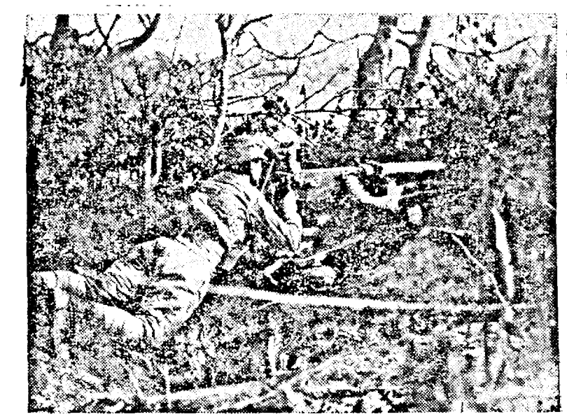
ATACUL CU MIHALIERA

Un ilustru ostaș francez, Generalul Gamelin, generalisimul armatei franceze, vorbind despre soldatul român și despre acțiunea de înzestrare a armatei române a spus următoarele: