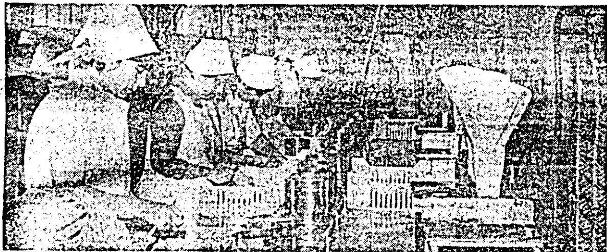
Întreprinderea de sere Arad. Harnicul colectiv de muncă de aici, realizează o gamă largă de produse apreciate, între care și conservele de ciuperci.