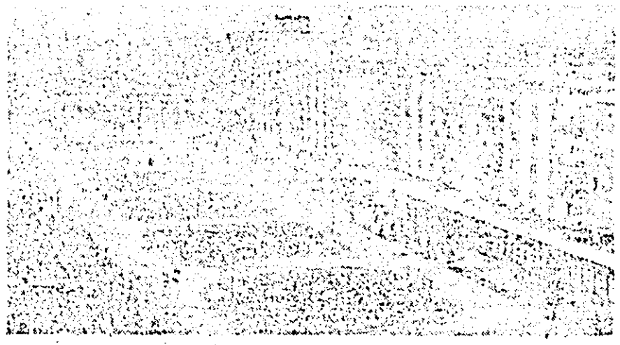
Imaginat a prezentului în vechiul cartier arădean Micăfaca.