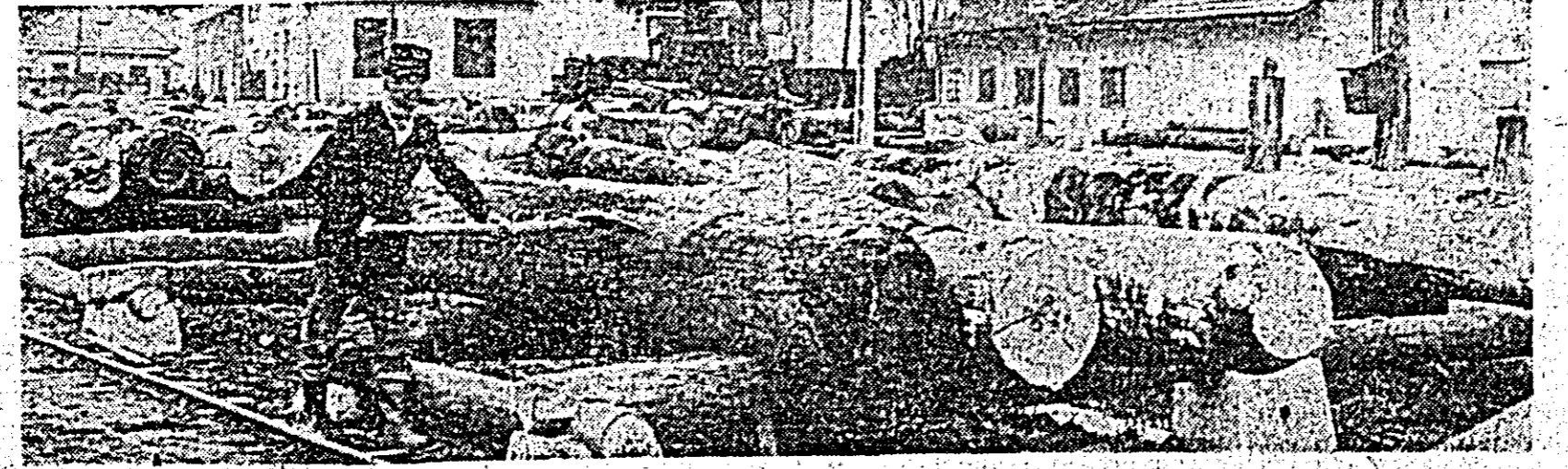
La fabrica de cherestea și parchete din Arad sosesc zilnic sute de bușteni. Transformați în scîndură, aceștia vor lua drumul fabricilor de mobilă sau spre alți beneficiari. Clieul de sus înfășează de pozitivul de bușteni, loc unde se face sortarea pe esențe și calități.