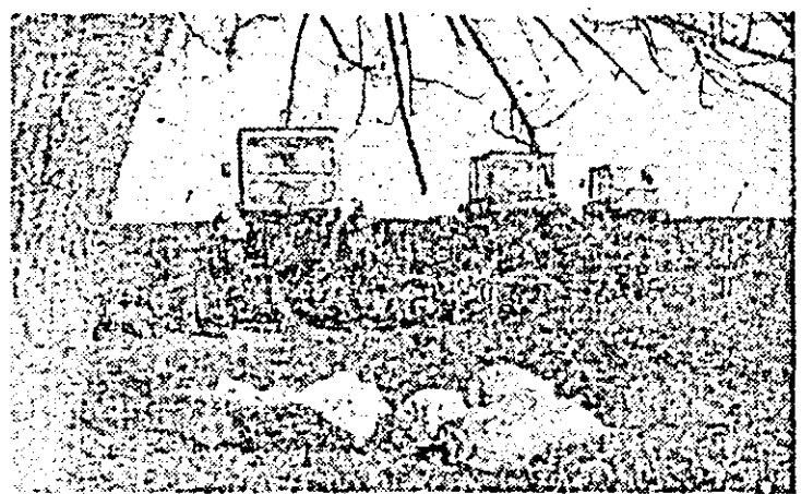
Semănatul porumbului se desfășoară în ritm susținut și pe ogoarele C.A.P. Sînpetru German.