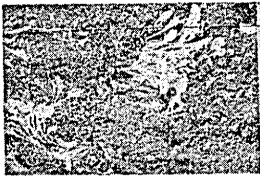
Săpe „bezmelice” au tălat fără milă stela de zahăr. Fotografia este făcută într-o parcelă a fermei vegetale nr. 2 de la C.A.P. Irațoașu.

Ne temem că omul ar putea avea dreptate, fiindcă într-adevăr, în cultură au rămas neincorporate în cantități destul de mari resturi vegetale. Iată de ce, mecanizatorul trebuie să lucreze cu atenție