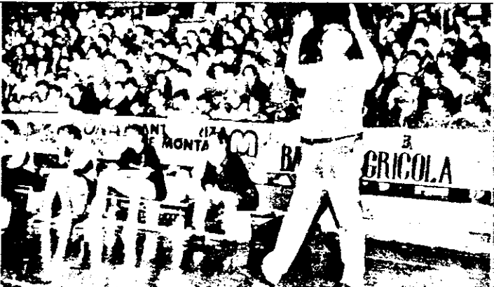
Antrenorul POP (U. Cluj) exprimându-și sugestiv părerea despre jocul echipei sale

Consfătuire cu antrenorii În data de 30 martie (miercuri) ora 12.00, la sediul AJF Arad va avea loc consfătuirea antrenorilor centrelor de copii și juniori din municipiu și județ. Prezența obligatorie. La consfătuire din partea FRF-ului va lua parte secretarul general al comisiei de specialitate (fotbal) N. Pantea.