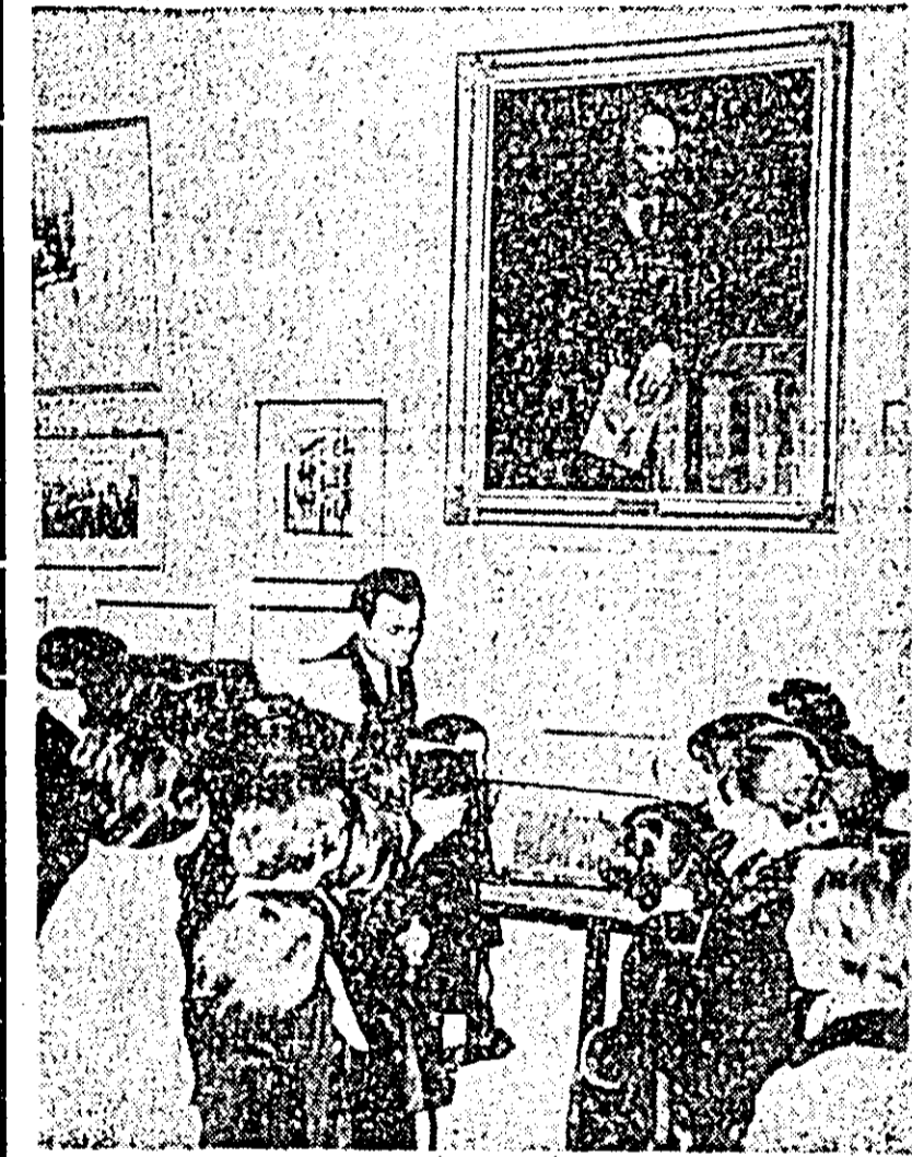
R.P. POLONA. IN FOTO: atit copii, cit și oameni maturi vizitează cu interes muzeul Lenin din Cracovia, unde sînt expuse fotografiile și documentele din viața lui Lenin.

Republica Somalia a fost constituită în 1960, cînd fosta Somalie italiană s-a reunit cu Somalilandul britanic. Țara are o suprafață de 635.000 km 2 pătrați și o populație de 3,5 milioane de locuitori. Pînă de curînd, resursele ei păreau limitate, iar agricultura, ramura de bază a economiei, supusă capriciilor meteorologice