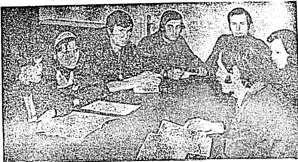
Membrii comitetului U.T.C. de la I.A.M.M.B.A. discutind despre pregătirea adunărilor generale ale organizațiilor de tineret din întreprindere.

Pentru a vedea cum se organizează și se desfășoară adunările generale U.T.C., conținutul de idei al acestora, felul în care prind viață propunerile făcute de către tineri, am întreprins o analiză în multe organizații U.T.C. din întreprinderile industriale ale municipiului.